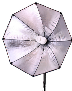
In positie klikken, draai de lamp in

Open de softbox en druk de centerring in de richting van de keramische fitting tot de middenring in positie "klikt".