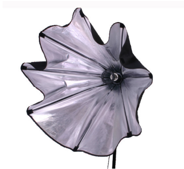
Druk de centerbeugel in de zetting van de softbox

Monteer de softbox op een verlichtingstandaard, en draai de knop op de voet van de standaardadapter totdat deze vast zit.