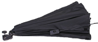
Softbox ingeklapt op te bergen

Deze softboxen zijn eenvoudig te gebruiken en te assembleren. Ze werken als een paraplu.