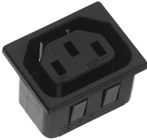
Einbau - Gerätesteckdose, Steckflansch. Alte K+B Serie 704