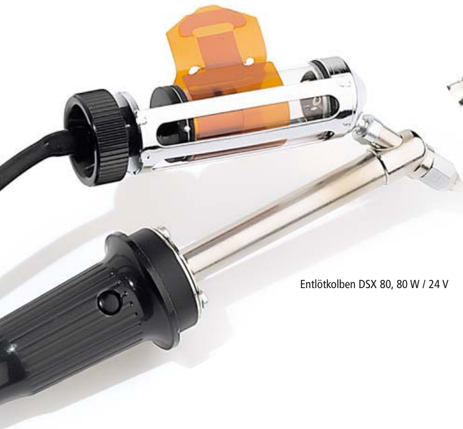
EntlötKolben DSX 80, 80 W / 24 V

Das neu entwickelte, innovative Entlötsystem ermöglicht das Löten, bzw. Entlöten großer SMT-Bauteile bis zu 30 x 30 mm. Das Entlötsystem ist an den zusätzlichen Vakuumkanal (Pick up) der WR 3M anschließbar.